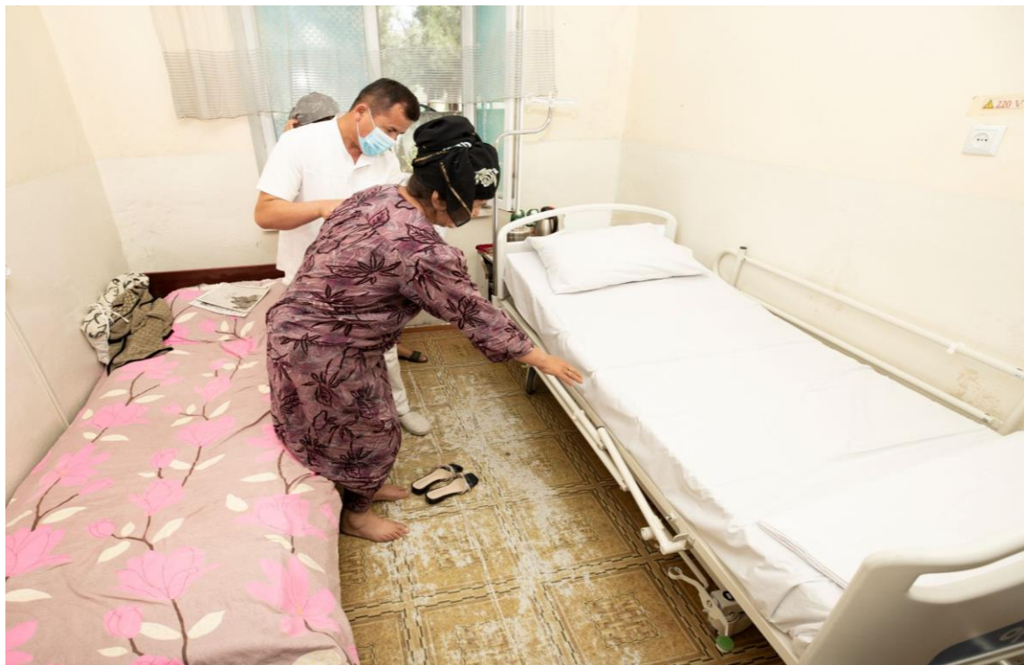
Пациентка перемещается со старой медицинской кровати на новую кровать, профинансированную KOICA, в Шахринавской больнице. 11 мая 2021 года, Таджикистан.