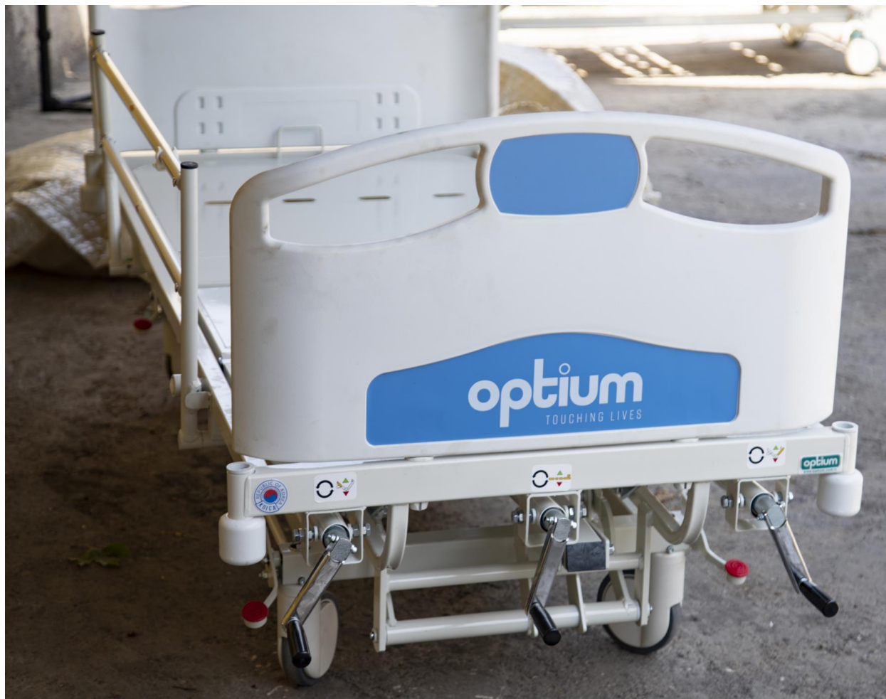
Медицинская кровать с логотипом KOICA в левом нижнем углу в Городском Медицинском Центре №1 имени К. Ахмедова в Душанбе, одной из тринадцати больниц, участвующих в проекте. 11 мая 2021 года.