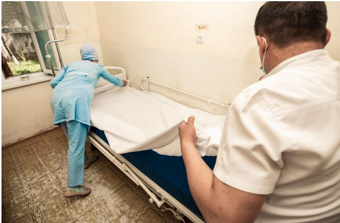
Медицинский персонал Шахринавской больницы, одной из тринадцати больниц, участвующих в проекте, застилает новую медицинскую кровать для пациентки, нуждающихся в стационарном лечении. 11 мая 2021 года, Таджикистан.