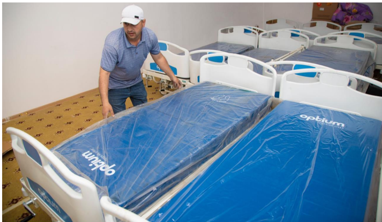
Поставки медицинских кроватей в Городской Медицинский Центр №1 имени К. Ахмедова в Душанбе, одну из тринадцати больниц, участвующих в проекте. 11 мая 2021 года.

«Для достижения целей стратегии Правительства Республика Корея «ODA Korea: Building TRUST» KOICA реализует Комплексную программу быстрого реагирования во многих странах. KOICA считает, что медицинские кровати, которые ЮНОПС успешно закупило и поставило, поможет Правительству Таджикистана в противодействии пандемии и создании устойчивой службы здравоохранения».